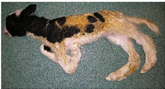
Zakażenie SBV – zaburzenia rozwojowe płodów –